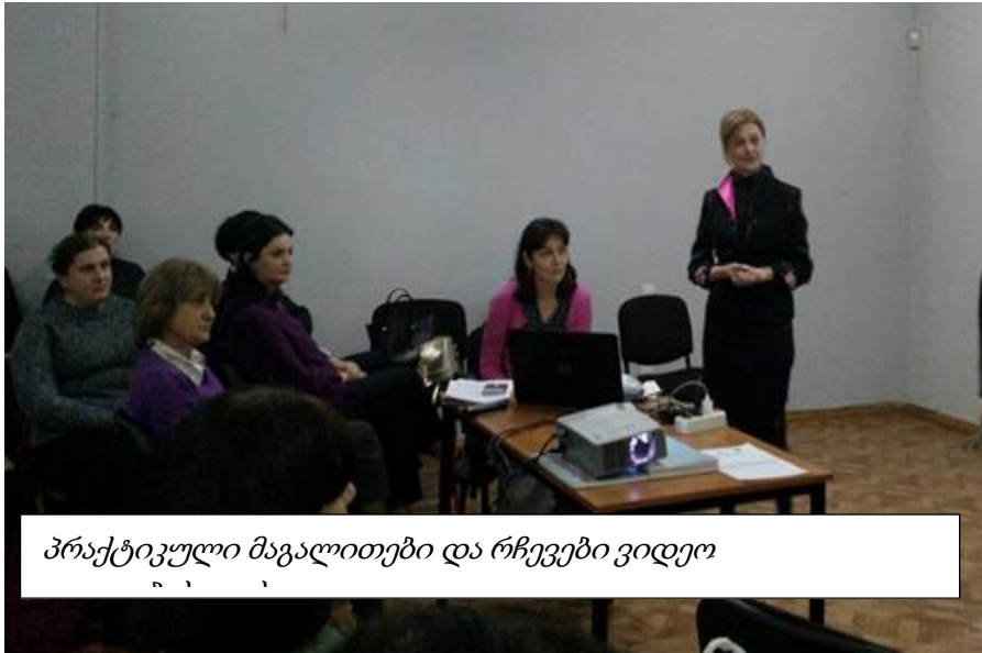
პრაქტიკული მაგალითები და რჩევები ვიდეო

ტრენინგს "ვიდეო, როგორც სწავლის ინსტრუმენტი პედაგოგებისა და სტუდენტებისთვის" და გაიარა შესაბამისი გადამზადება.