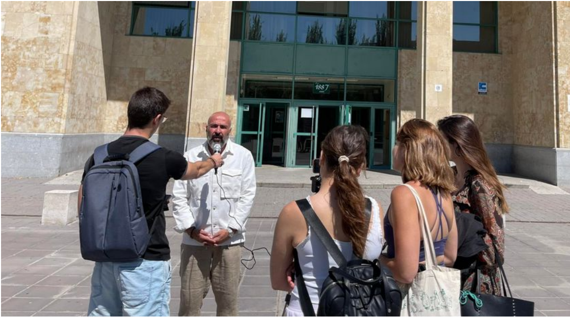
ჟურნალისტიკის სპეციალობის სტუდენტებთან ერთად გადაცემის მომზადების პროცესი