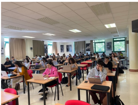
ესპანელი სტუდენტები ლექციაზე