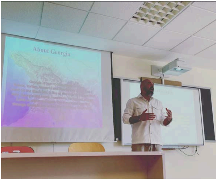
სტუდენტებთან ლექციების კურსის დასაწყისში საუბარი ეხება საქართველოს და საქართველოს განათლების სისტემას