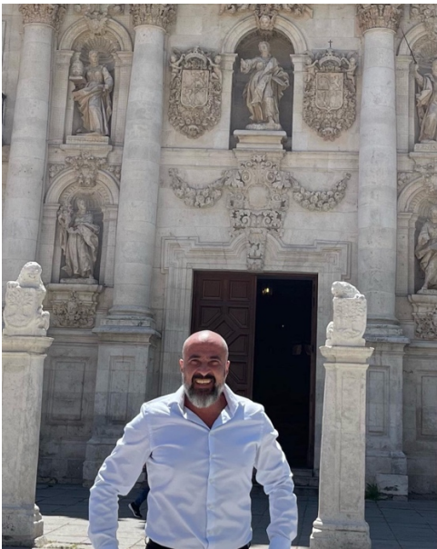
ვალადოლიდის უნივერსიტეტის ისტორიული შენობა