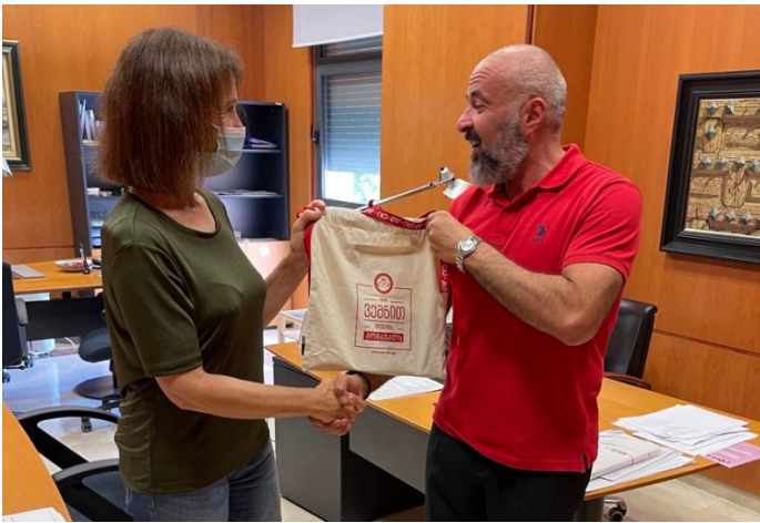
შეხვედრა საერთაშორისო ურთიერთობათა ოფისში

დაგეგმილი აკადემიური საქმიანობის წარმატებით შესრულება უნივერსიტეტმა შესაბამისი სერტიფიკატით დაადასტურა.