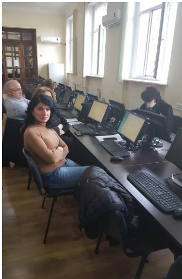
საბოლოო პროექტაციისათვის მზადება

ტრენინგში აქტიურად ჩართულმა პროპფესორ-მასწავლებელმა კურსის დასასრულს შეაფასეს კურსი.