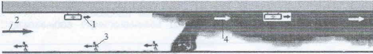
ნახ. 1. გვირაბის ვენტილაციის სქემა, როცა ვენტილატორებით აღძრულ ჰაერის ნაკადს და ხანძრით განპირობებულ კვამლის ნაკადს თანხვედრილი მიმართულება აქვთ: 1 - ჰაერის ნაკადის მიმართულება ჭავჭავი ვენტილატორიდან; 2 - სავენტილაციო ნაკადის მოძრაობის მიმართულება; 3 - ევაკუაციის მიმართულება; 4 - კვამლის გაფრცელების მიმართულება

გარემოს შექმნის გამო ევაკუაცია ამ ადგილებში, დროის მითითებული პერიოდის გასვლის შემდეგ, შეუძლებელი ხდება.