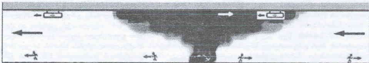
ნახ. 2. გვირაბის ვენტილაციის ნახაზზე 1 გამოსახული სქემა ჭავჭავი ვენტილატორების რევერსირების შემდეგ

აღსანიშნავია, რომ კოლაფსის პერიოდისათვის სავენ-