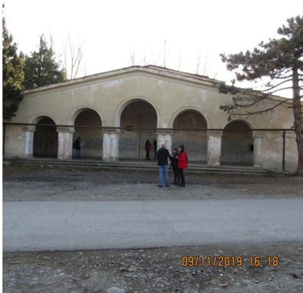
ასევე ტყვიავშიც მოხდა არსებული შენობის აღწერა,