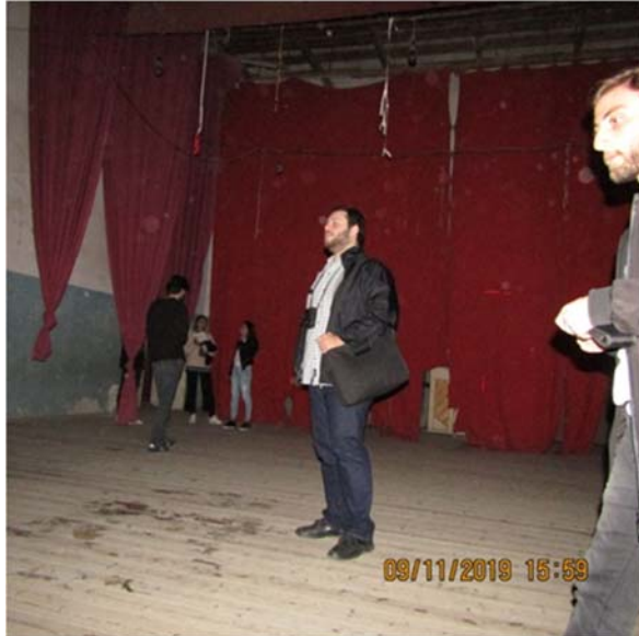
ფოტო ფიქსაცია, ჩატარდა აზომვითი სამუშაოები, ადგილზევე დაისახა შემდგომში გასაგრძელებელი სამუშაოები.