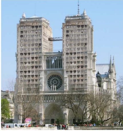
Notre Dame De Mtskheta