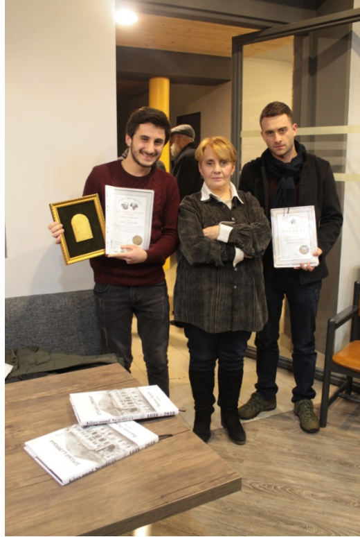
დაჯილდოებაზე გამარჯვებული სტუდენტები და მათი ხელმძღვანელები