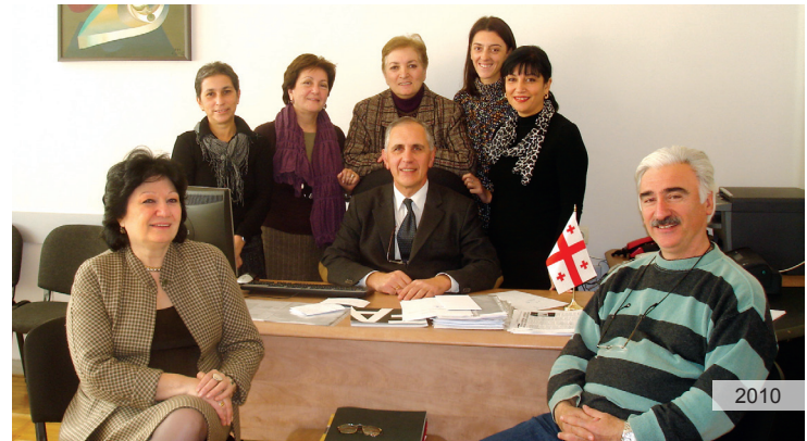
ფაკულტეტის დეკანატის თანამშრომლები / Staff of the Deans office

In accordance with fundamental principles of the Bologna Declaration, learning process at the Faculty of Architecture, Urban Studies and Design consists of three stages. The first four years include professional and undergraduate (Bachelor's degree) programmes; the second stage takes two years and includes Master's programmes; the third, three-year long step is the Doctorate. The Faculty of architecture enrolls around seven hundred students and enjoys the expertise of 130 professors and teachers.