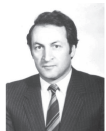
გიორგი სალუქვაძე GIORGI SALUKVADZE