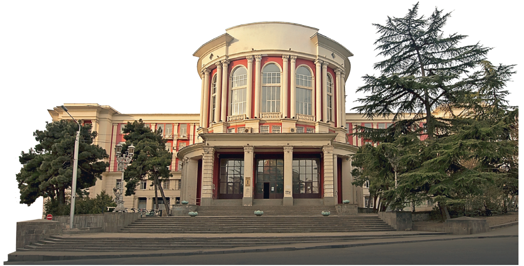
საქართველოს ტექნიკური უნივერსიტეტის I კორპუსი / I corps. of the Georgian Technical University

The originality of the heritage of Georgian architecture surviving to our day, clearly speaks to the fact that our country has seen many talented architects since ancient times. Georgian historical sources preserve their names and the heritage they left to the future generations are masterpieces that belong to universal cultural values.