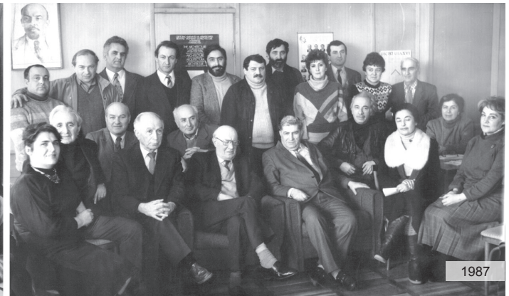
ფაკულტეტის თანამშრომლები / Staff of the Faculty