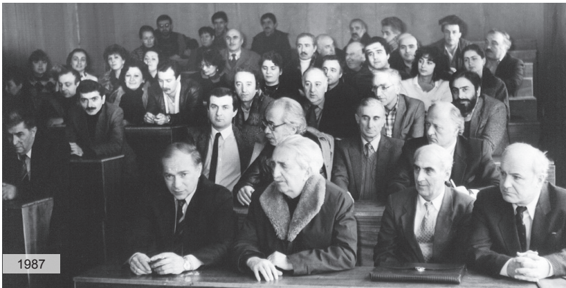
ფაკულტეტის კრება / Council of the Faculty