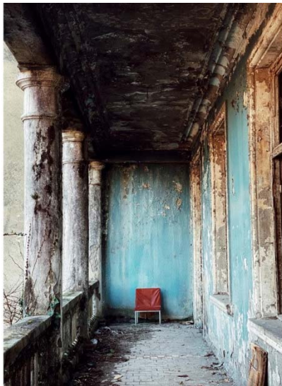
ავტორი ანი გომთელიანი 2 ადგილი