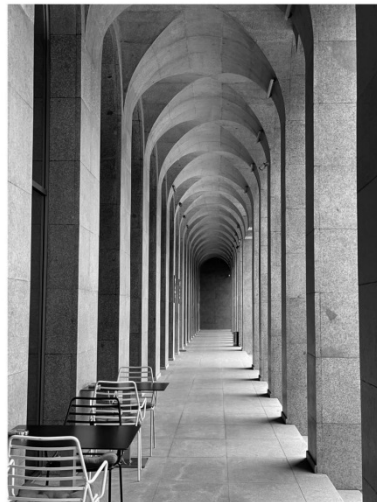
ავტორი თეკლა კანდელაკი ფაბ-ლაბის რჩეული