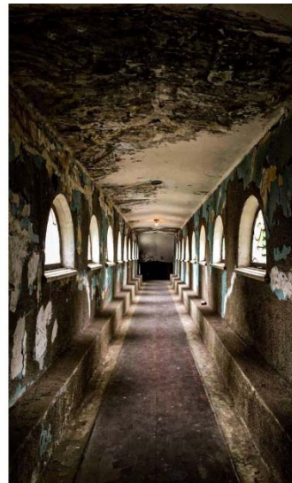
თამუნა ვერეჯიშვილი, თსს აკადემია, 2 ადგილი