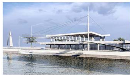
საქართველოს საგზაო-საჰაერო ტერმინალი