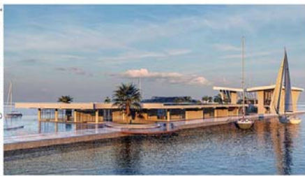
Passenger terminal of Poti port