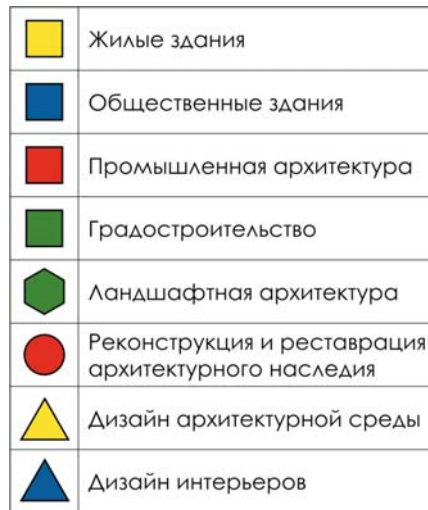
Рис. 3 Символы обозначения направлений по номинации «Курсовой проект»